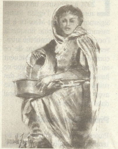
La vie est une femme... un dessin au fusain de Mireille Zagolin-Bourgeois.

Vernissage samedi 6 novembre, dès 16 heures, en présence de l'artiste.